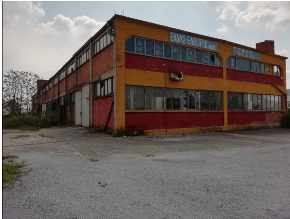
Εξωτερική άποψη ακινήτου