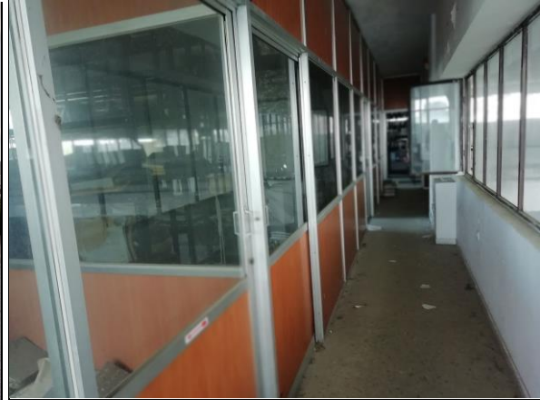
Εσωτερική άποψη χώρου γραφείων