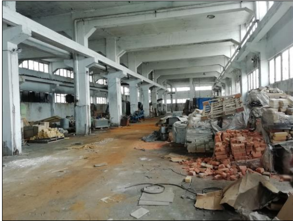
Εσωτερική άποψη βιομηχανικού χώρου