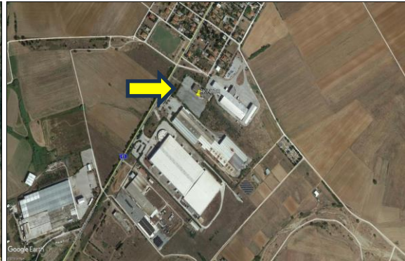
Δορυφορική Φωτογραφία Θέσης