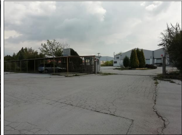
Θέση σύνδεσης με όμορο γήπεδο