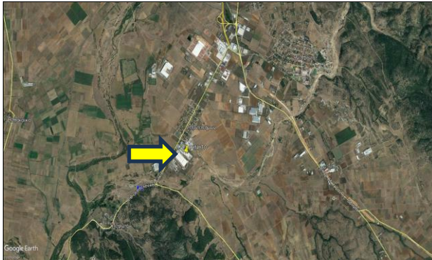
Δορυφορική Φωτογραφία Ευρύτερης Περιοχής